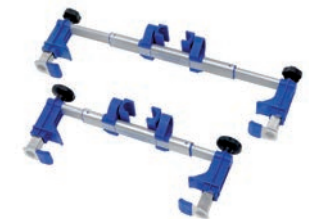
Rückenklammer für PT Uni

Breite Ausführung: 360-560 mm, Art. Nr. 945 131