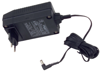
Netzladegerät BC-PT mit Euro Stecker

Das Zubehör für die LIFTKAR PT-Modelle ist auf die individuellen Bedürfnisse und Ansprüche von Menschen mit Gehbeeinträchtigung maßgeschneidert. Die Qualität der technischen Lösung und der Ausführung stehen dabei im Vordergrund.