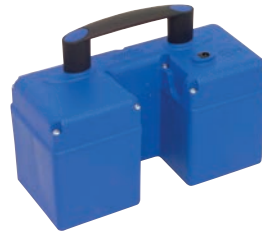
Schnellwechselakku BU PT 5,2 Ah

Gewicht 4,3 kg, Kapazität 5,2 Ah, Spannung 24 VDC