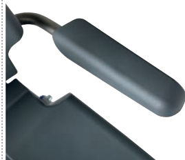
Armlehnen mit weicher Auflage