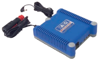
KFZ-Ladegerät BC 10-30 VDC-PT