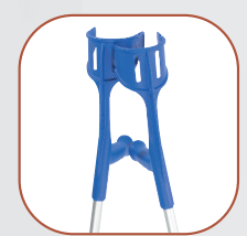
... und steht!